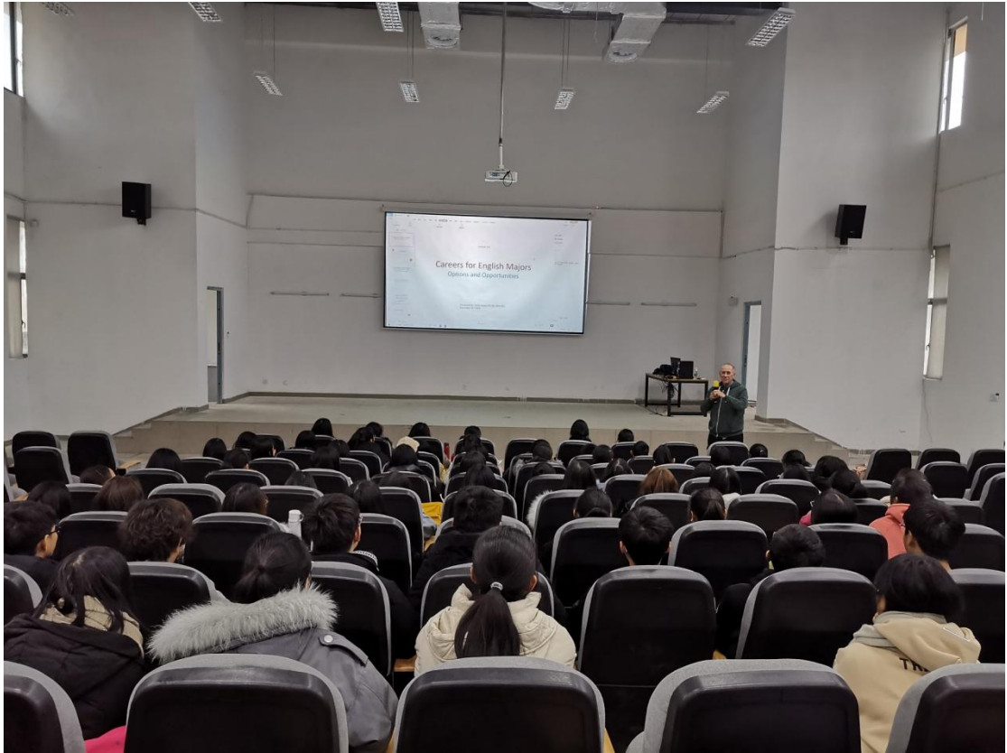
外籍教授口语讲座