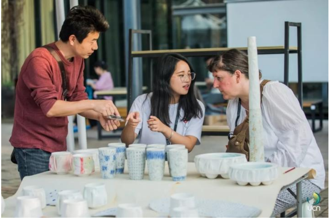
陶溪川春秋大集-帮助外国艺术家销售作品