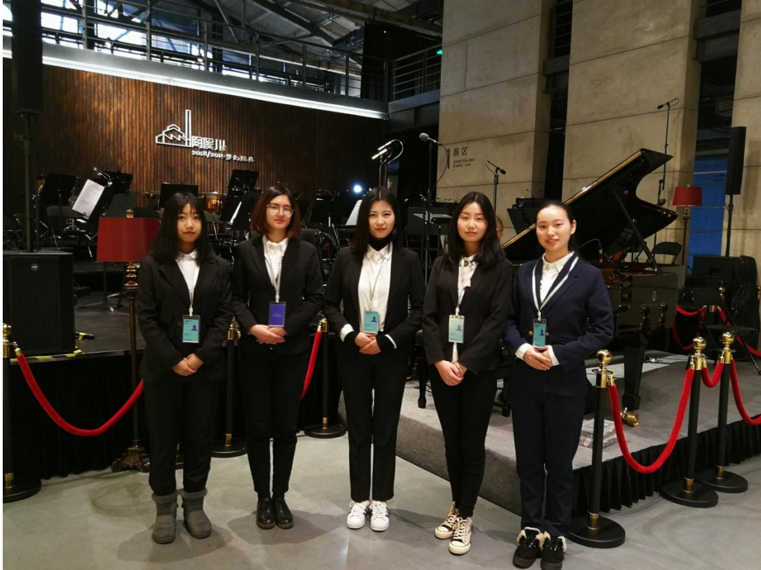
陶溪川国际音乐节-学生志愿者参加外事翻译服务

商务英语专业积极进行校企合作，实行“立体化实践教学体系”，建立 10 多个实践、实习教学基地，打通课内课外、校内校外，深入产学研合作，邀请企业讲师进校园，校企互动促发展。