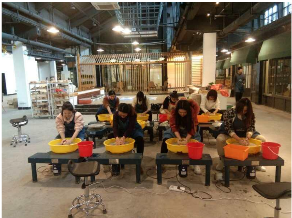
陶溪川陶公塾-商务见习