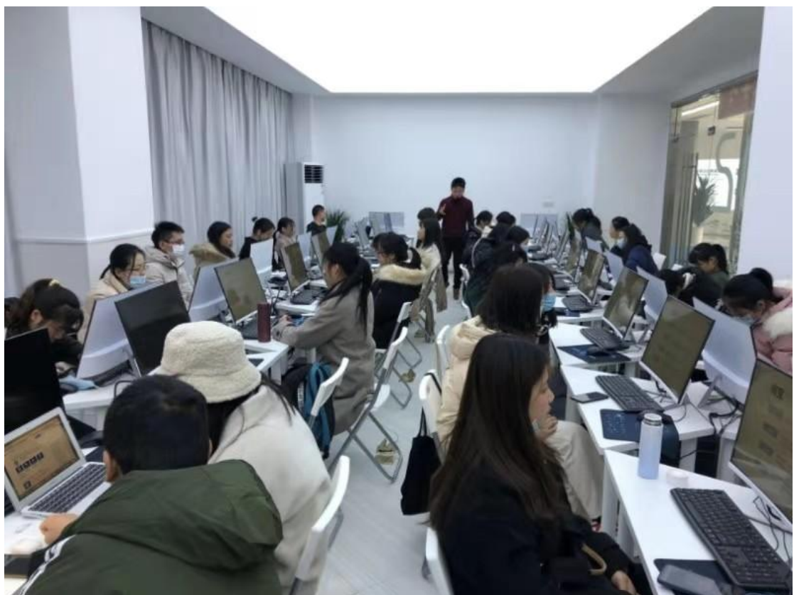
跨境电商企业培训课