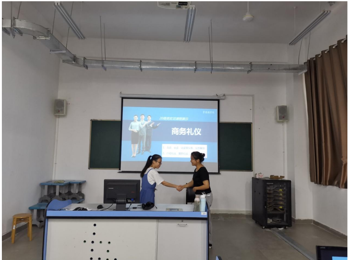
商务礼仪实践教学