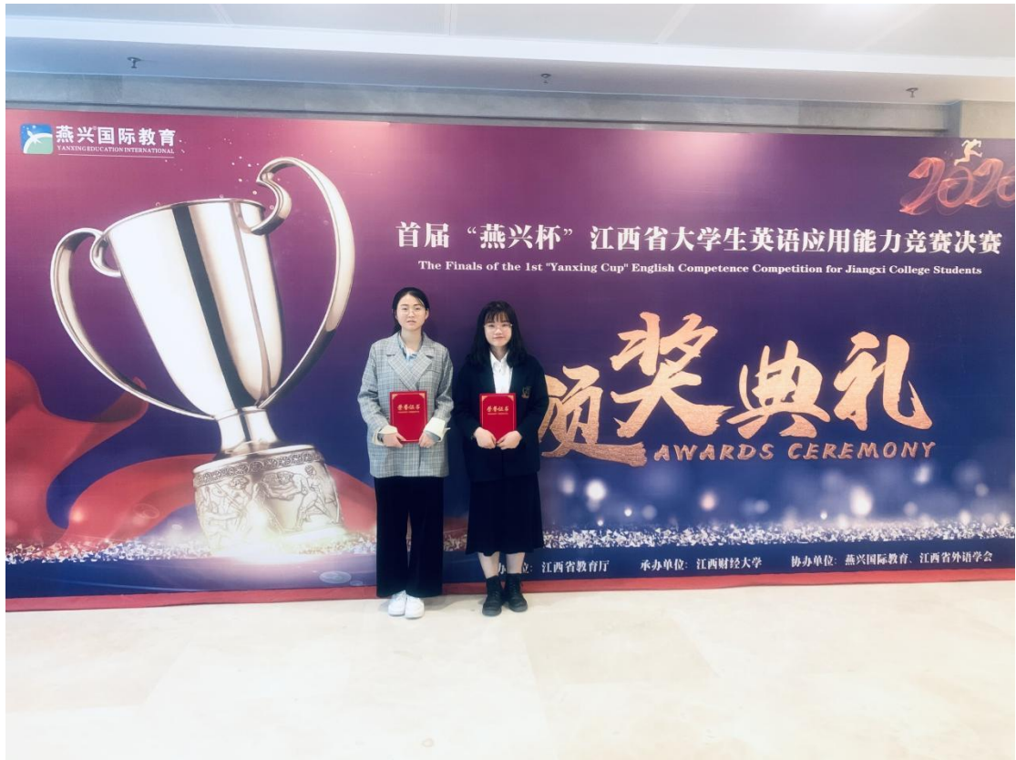
“燕兴杯”大学生应用能力竞赛