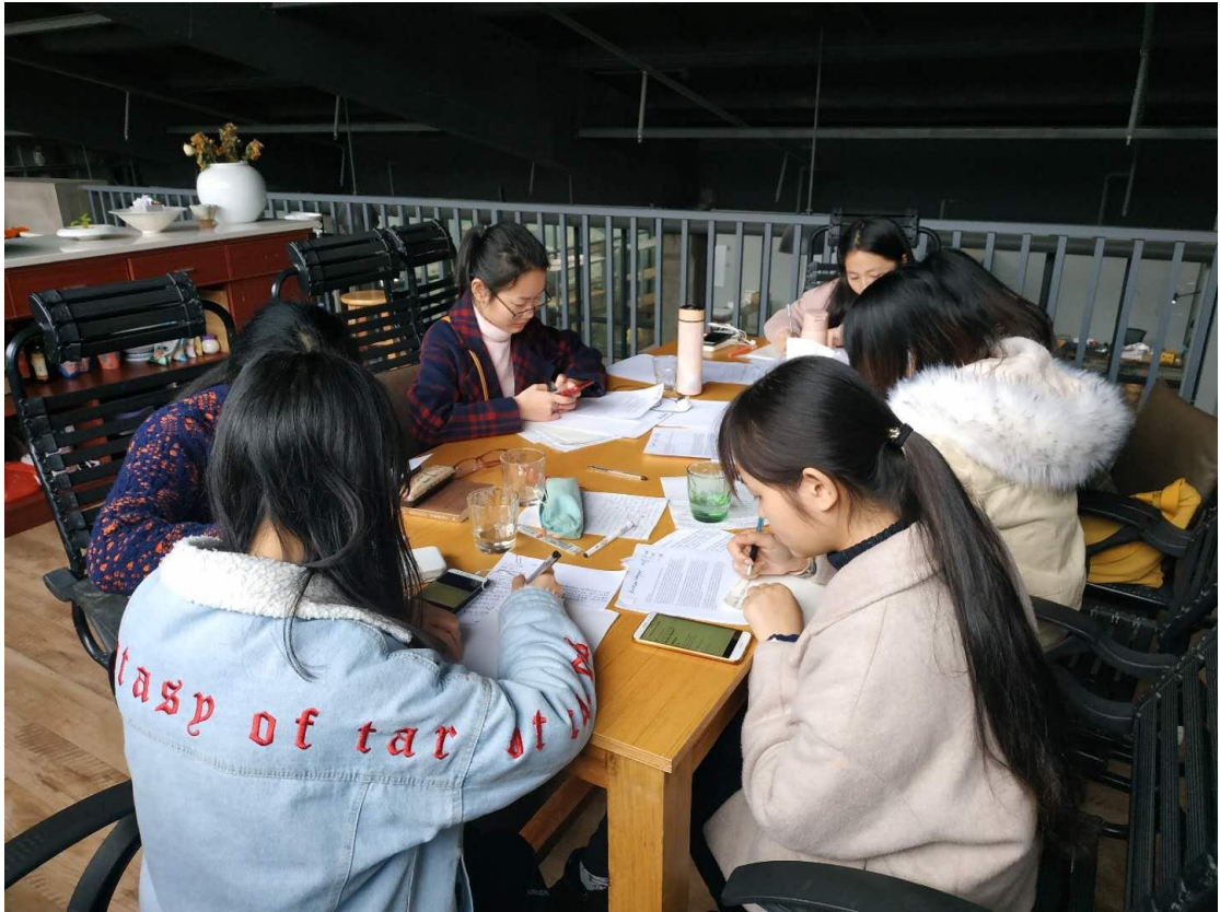
学生在陶溪川国际工作室进行翻译工作