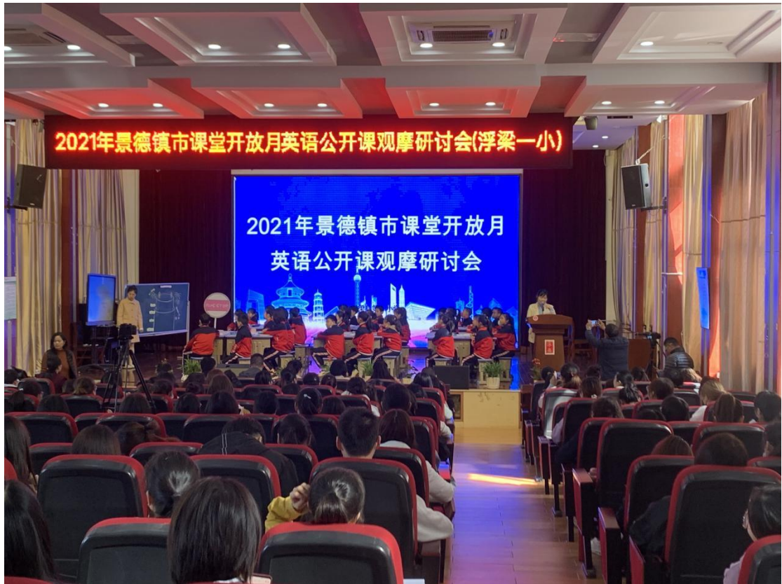
师范生参加市中学英语公开课观摩研讨