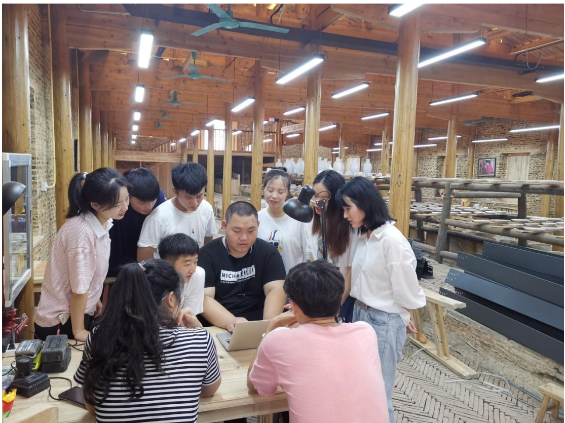
陶阳里商务见习-集中研讨翻译材料