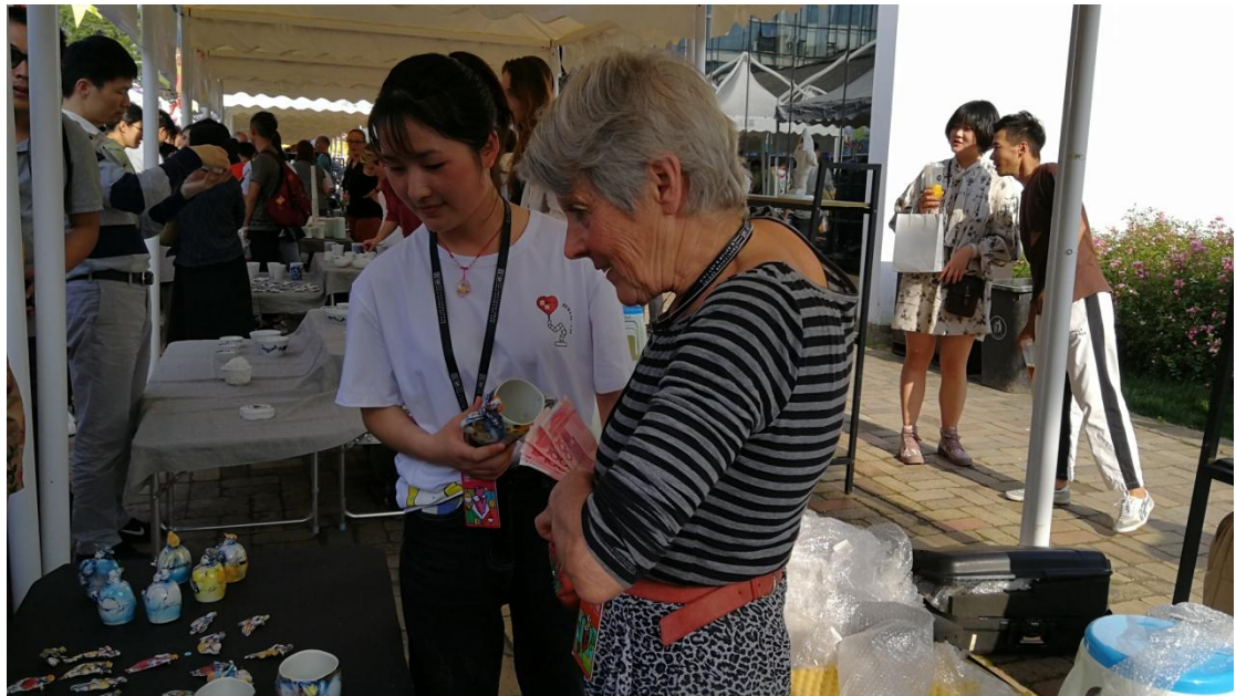
陶溪川春秋大集-帮助外国艺术家销售作品