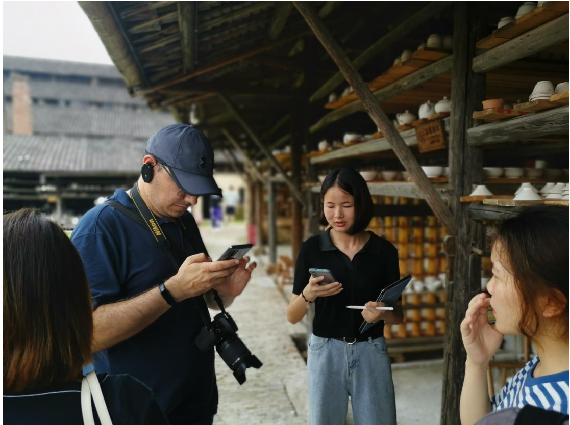
陶阳里商务见习-帮助外国友人购买陶瓷