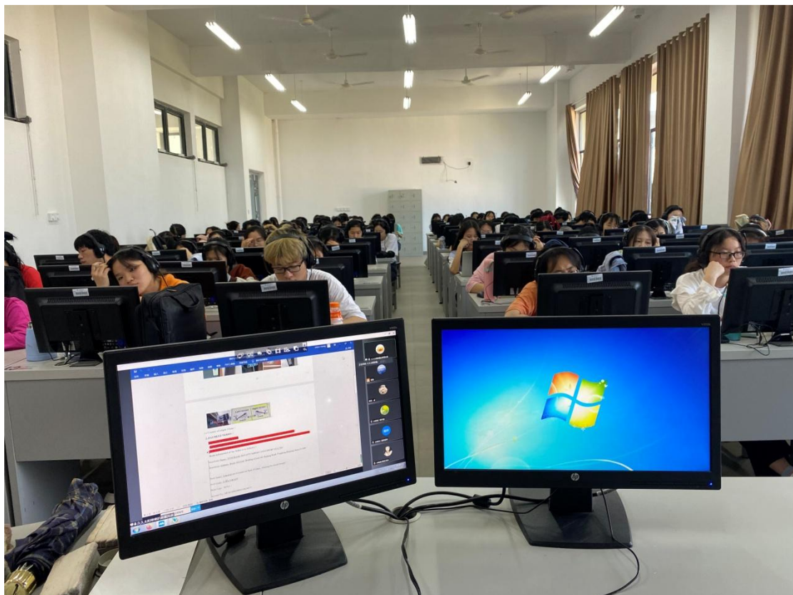
企业讲师线上线下讲授商务单证缮制实践课程