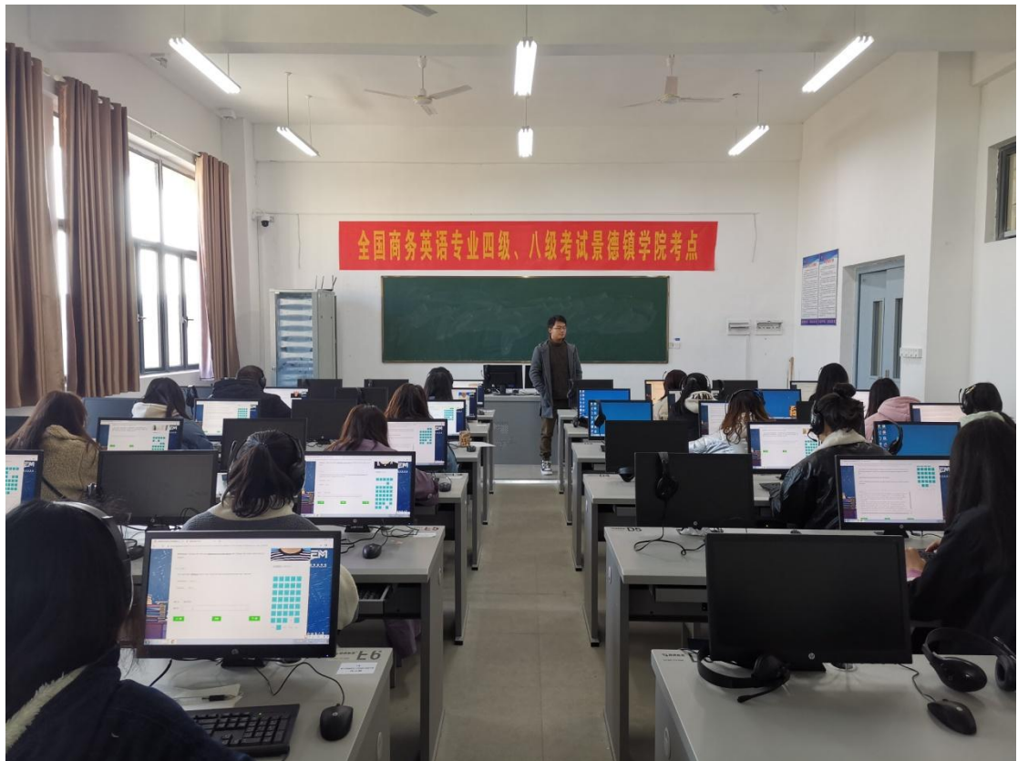
全国商务英语专业四、八级考试