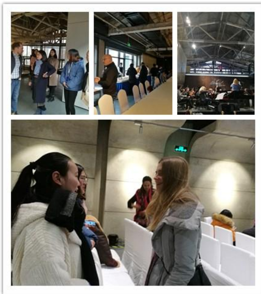
陶溪川国际音乐节-学生志愿者参与外事接待