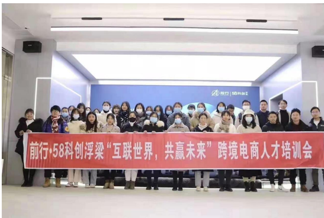
跨境电商人才培训会

商务英语专业每年组织参加全国商务英语实践技能大赛，训练学生商务基本能力和综合商务素质，并多次荣获江西省赛区三等奖。同