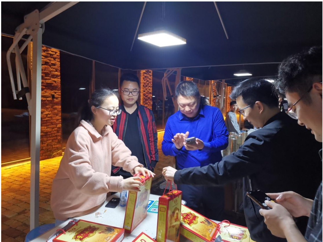
江西省旅发大会-天工开物特产销售