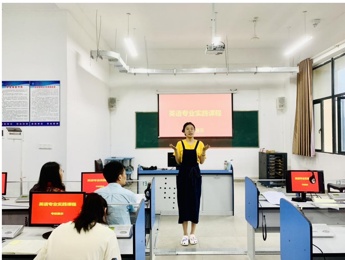
实践课程考核展评