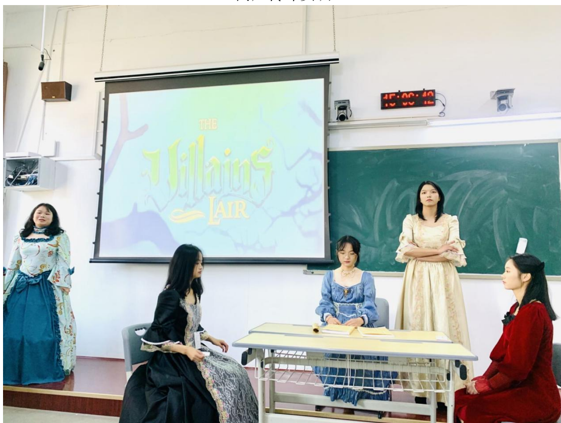
英美文学经典作品角色扮演