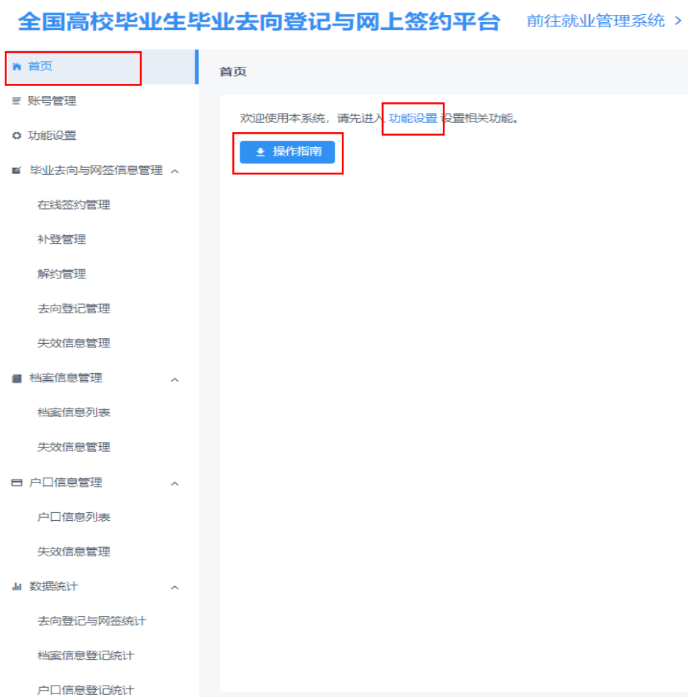
图 3 平台首页

省级用户菜单栏包括首页、账号管理、功能设置、毕业去向与网签信息管理、档案信息管理、户口信息管理、数据统计。