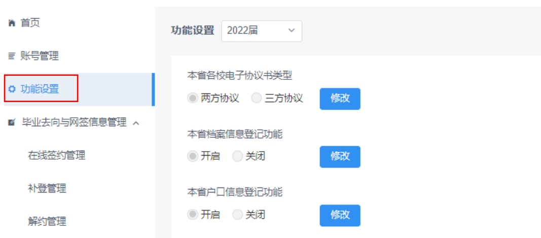
图 5 功能设置