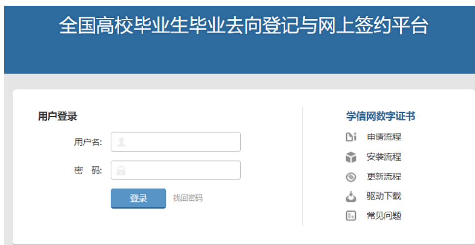
图 2 用户登录