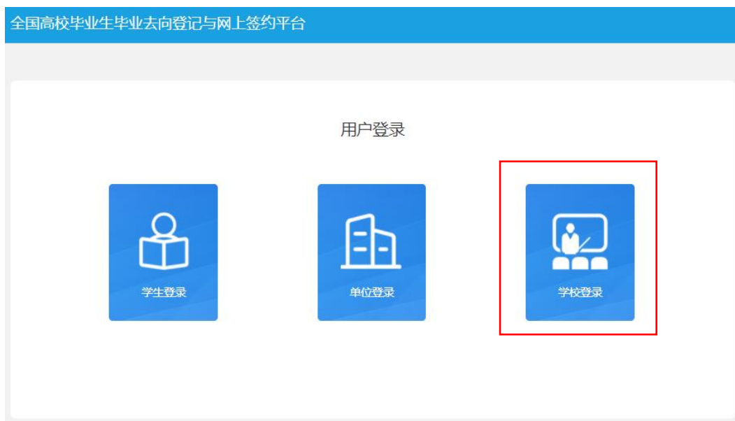
图 1 选择登录用户

省级用户进入登记平台（ wq.ncss.cn ），选择“学校登录”，使用全国高校毕业生就业管理系统（以下简称“就业管理系统”）账号登录。